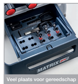
Veel plaats voor gereedschap