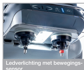
Ledverlichting met bewegingssensor

Dankzij een transparant veiligheidsscherm en een thermisch-magnetische netschakelaar is de machine ook veilig voor de gebruiker.