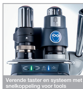
Verende taster en systeem met snelkoppeling voor tools