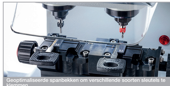
Geoptimaliseerde spanbekken om verschillende soorten sleutels te klemmen

De machine is uitgerust met een verende taster, een micrometrische regelring en een exclusieve zelfcenterende tang voor nauwkeurige kalibratie en freesresultaten van hoge kwaliteit. Het elektromechanische tastersysteem beschikt over een intuïtief display voor het controleren van de juiste instellingen van de tools vóór het frezen.