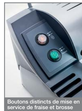
Boutons distincts de mise en service de fraise et brosse

L'interrupteur magnétothermique garantit une sécurité maximum à l'opérateur. En cas de panne de courant, il faut rallumer la machine manuellement. On ne détèlera le chariot qu'après avoir abaissé les calibres pour éviter toute rupture accidentelle.