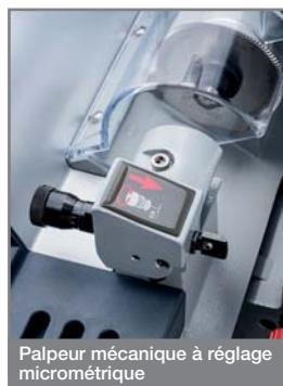
Palpeur mécanique à réglage micrométrique

La machine est dotée d'un palpeur mécanique à réglage centésimal grâce à une bague micrométrique (+/- 0,05 mm).