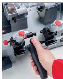
On détèle le chariot en appuyant sur un bouton dédié